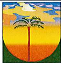
LA PLAINE DES PALMISTES